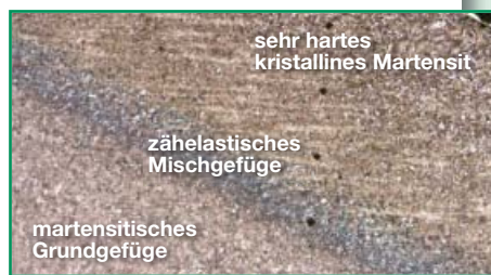
Mikroskopische Aufnahme zur Kontrolle der Gefügewandlung.